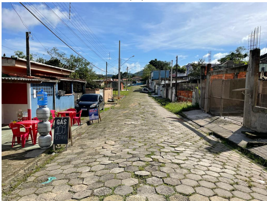
FIGURA 03: RUA A SER PAVIMENTADA