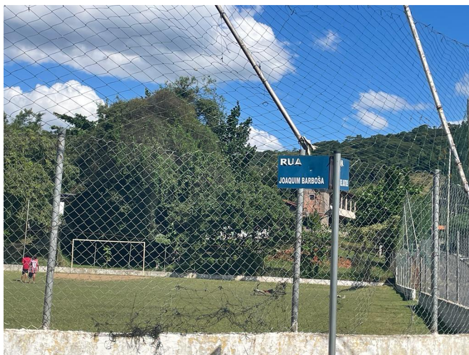
FIGURA 13: RUA JOAQUIM BARBOSA A SER RECAPEADA