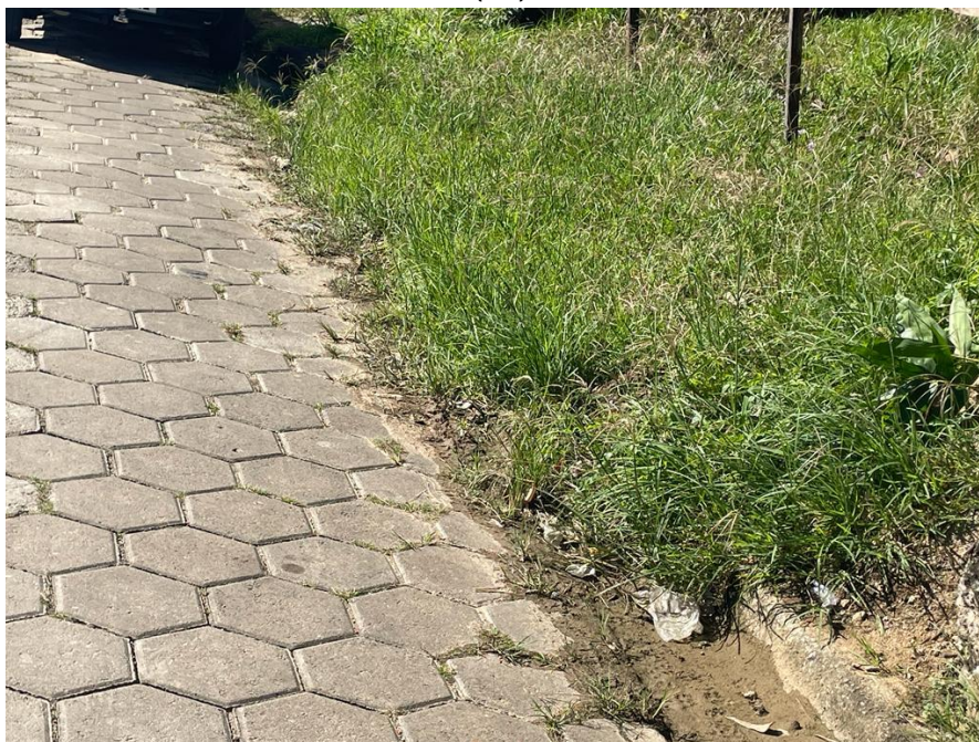
FIGURA 19: RUA COM AS GUIAS DANIFICADAS E SEM CALÇADAS