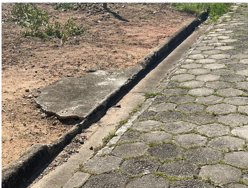
FIGURA 18: RUA COM AS GUIAS DANIFICADAS E SEM CALÇADAS