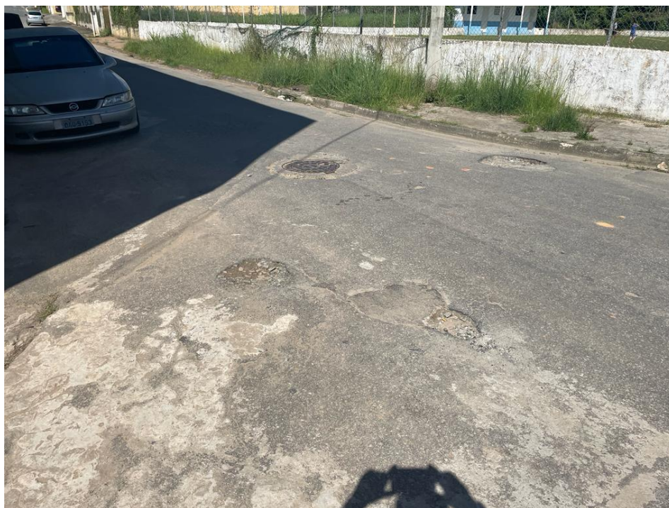
FIGURA 12: RUA JOAQUIM BARBOSA A SER RECAPEADA