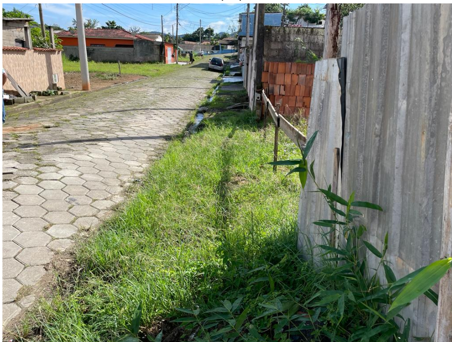
FIGURA 05: CALÇADAS A SEREM EXECUTADAS