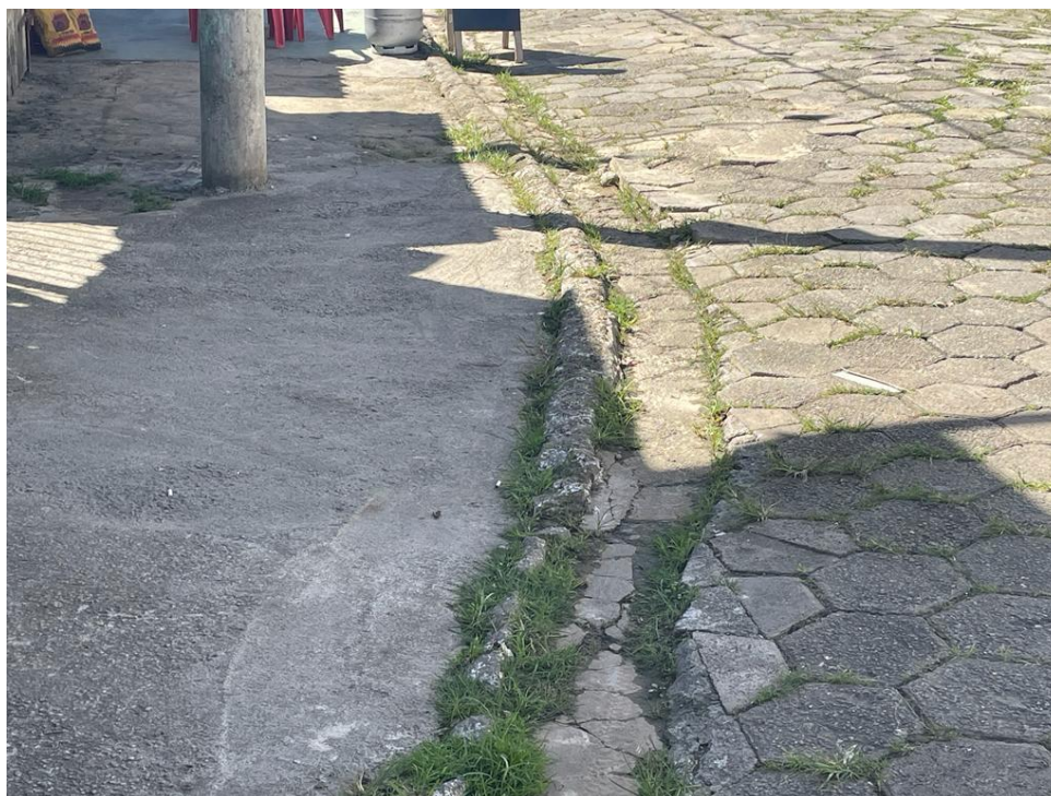
FIGURA 17: RUA COM GUIAS E SARJETAS DANIFICADAS