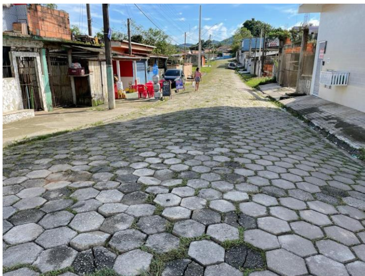
FIGURA 01: LAJOTAS SOLTAS A SEREM RETIRADAS

LOCAL: RUA GABRIEL BASTIDES COM JOAQUIM BARBOSA - BAIRRO VILA SOROCABANA - PEDRO DE TOLEDO/SP.