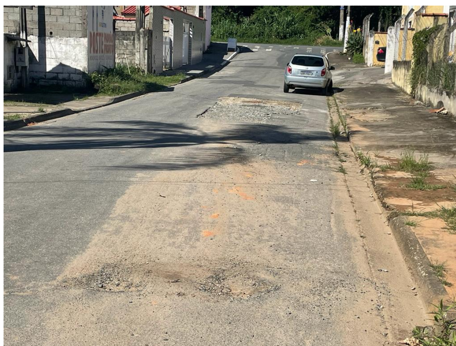
FIGURA 14: RUA JOAQUIM BARBOSA COM O PAVIMENTO DANIFICADO