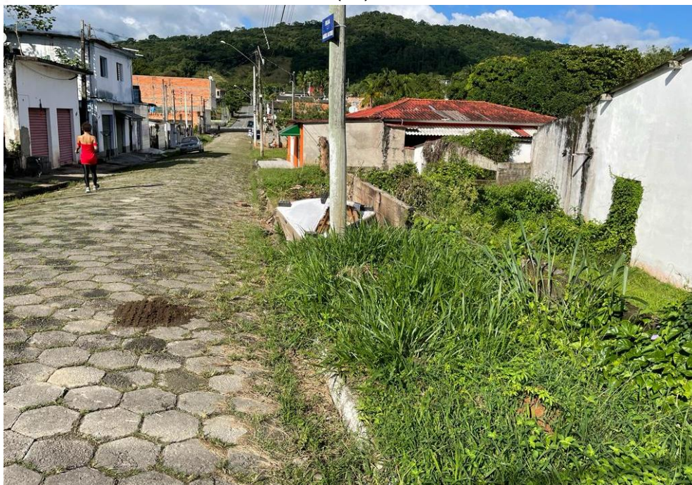
FIGURA09: RUA SEM CALÇADAS COM GUIAS DANIFICADAS E LAJOTAS SOLTAS