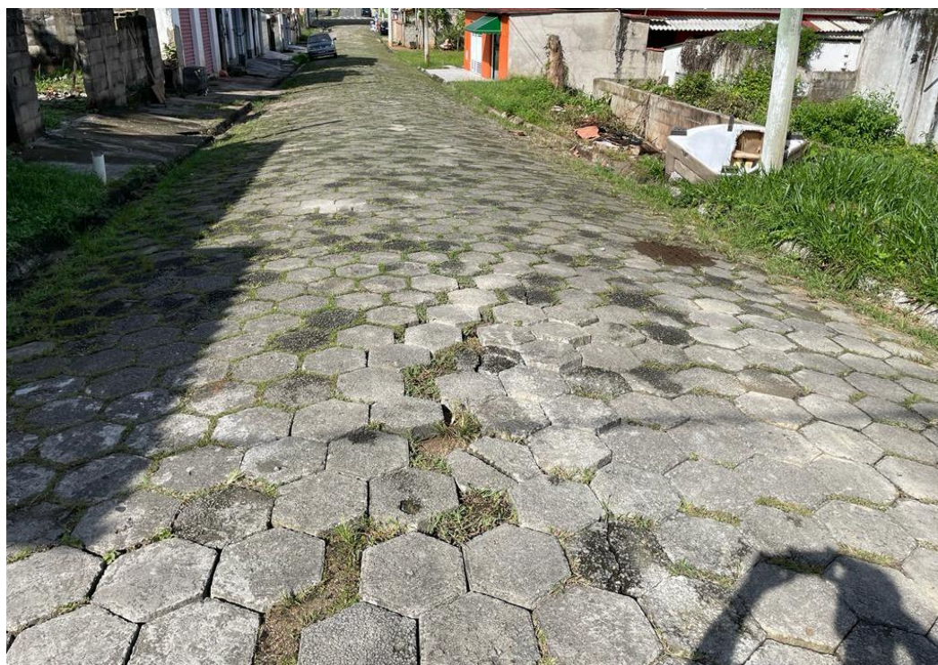
FIGURA 10: RUA SEM CALÇADAS COM GUIAS DANIFICADAS E LAJOTAS SOLTAS