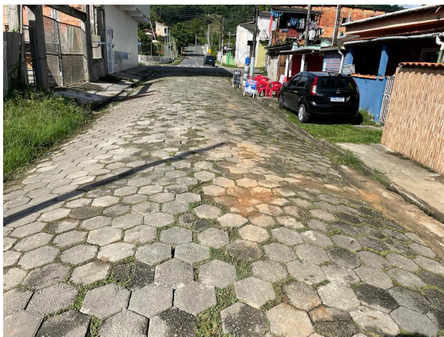
FIGURA 06: RUA GABRIEL BASTIDES A SER PAVIMENTADA