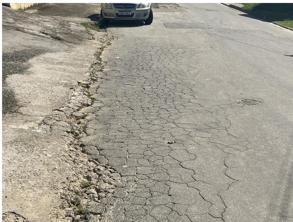
FIGURA 16: PAVIMENTO CRAQUELADO