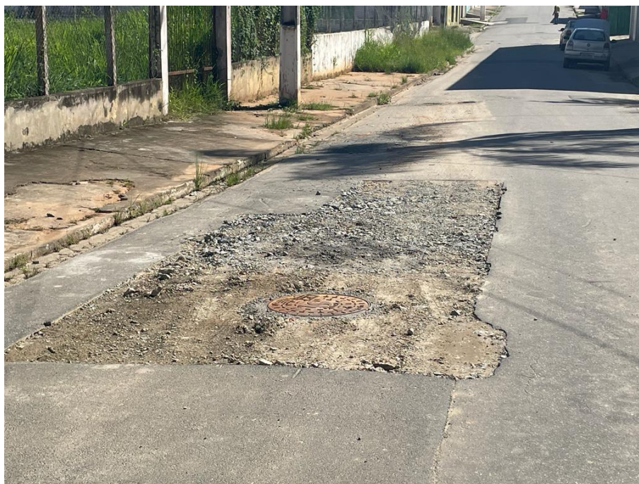
FIGURA 15: RUA JOAQUIM COM BURACOS E FALTA DE CAPA ASFÁLTICA