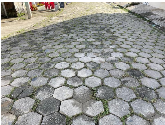
FIGURA 02: LAJOTAS SOLTAS A SEREM RETIRADAS