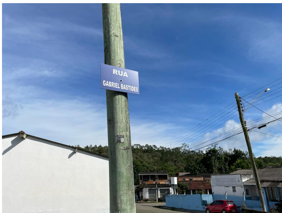
FIGURA08: RUA GABRIEL BASTIDES