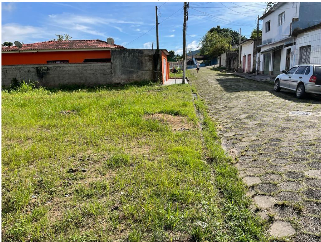
FIGURA07: RUA SEM CALÇADAS