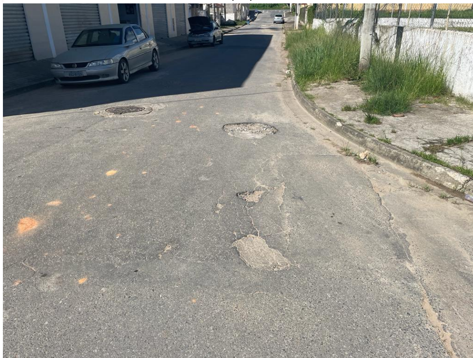
FIGURA 11: RUA JOAQUIM BARBOSA A SER RECAPEADA